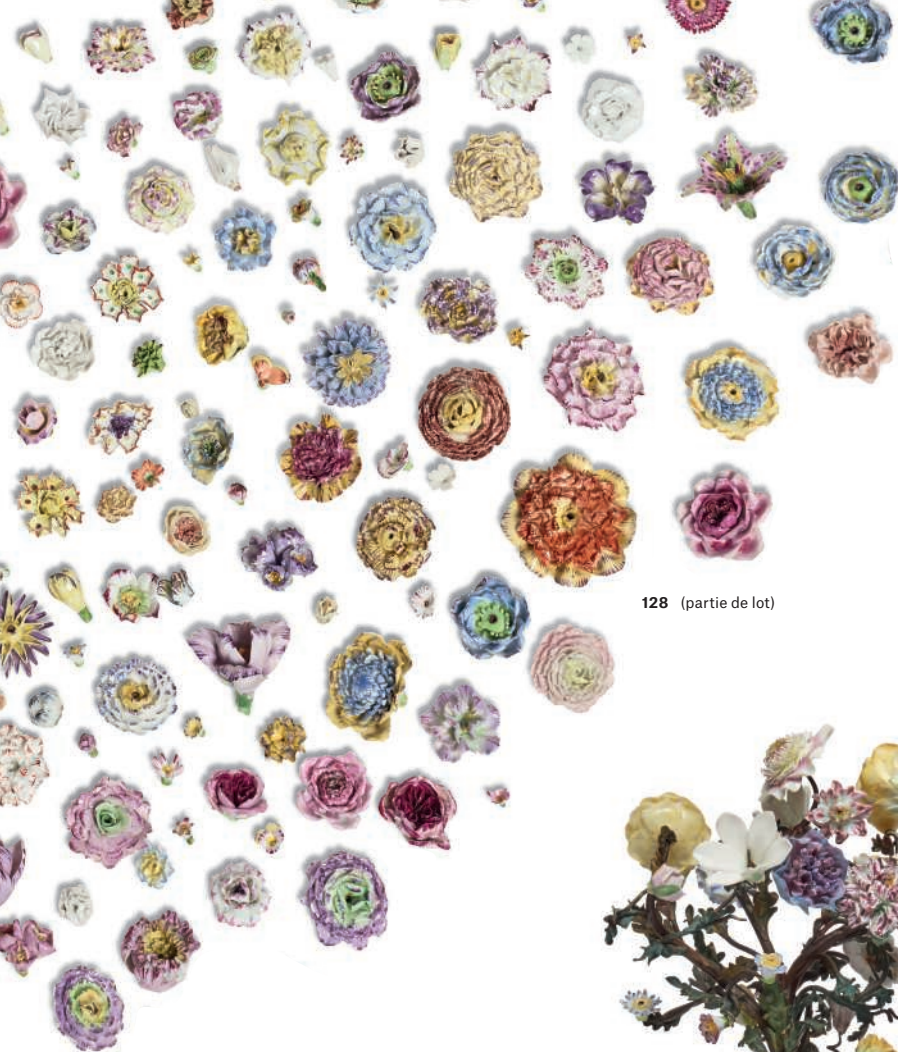
128 (partie de lot)