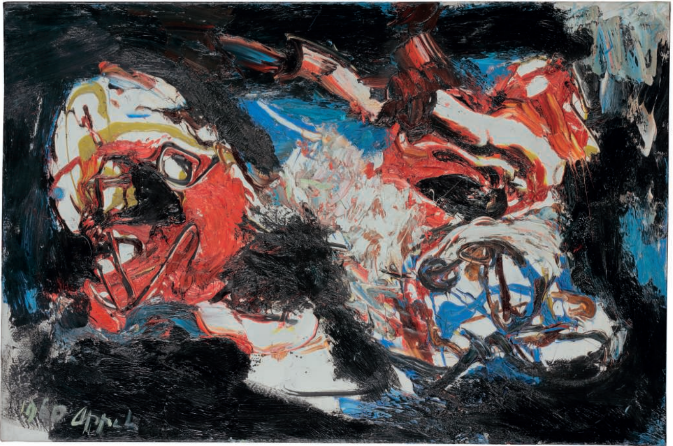
KAREL APPEL (1921 - 2006) Têtes dans Tempête (Heads in the Tempest) signed and dated '1960 Appel' (lower left); titled 'Têtes dans Tempête' (on the stretcher) oil on canvas 97 x 146 cm. Executed in 1960 €120,000 - 160,000