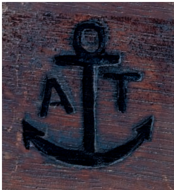
110 (détail de la marque au feu du château d'Anet)

A LOUIS XV FORMOLU-MOUNTED CHINESE LACQUER COMMODE STAMPED BY LEONARD BOUDIN, MID-18 th CENTURY FROM CHATEAU D'ANET FOR DUC DE PENTHIEVE