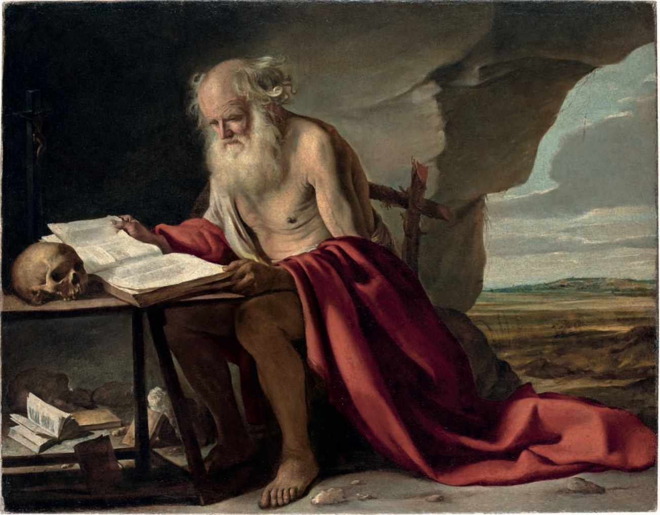
The Le Nain Brothers Saint Jerome oil on canvas 28 ¼ x 36 ¼ in. (71.5 x 92 cm.) $1,000,000 – 1,500,000